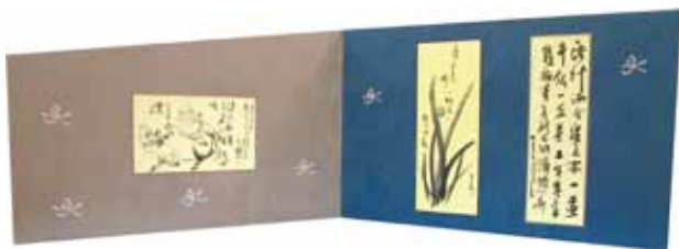
屏風「カレンダー絵図張」 中井青雲堂（堺市） 中井勝幸