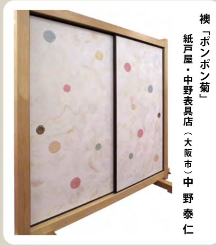
襖「ボンボン菊」 紙戸屋・中野表具店（大阪市）中野泰仁