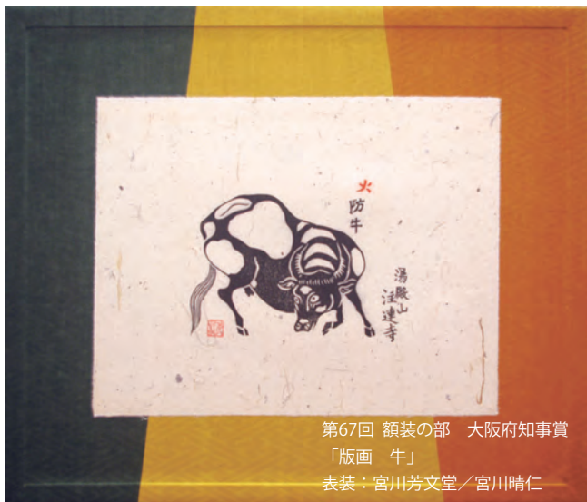
第67回 額装の部 大阪府知事賞 「版画 牛」 表装：宮川芳文堂／宮川晴仁

伝統的な表具から、新しい素材を駆使して現代風にデザインした創作表具まで、幅広い表具のあり方をご堪能いただければ幸いです。