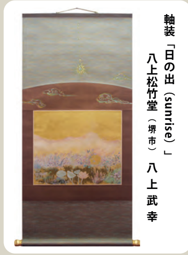
軸装「日の出 (sunrise)」 八上松竹堂（堺市） 八上武幸